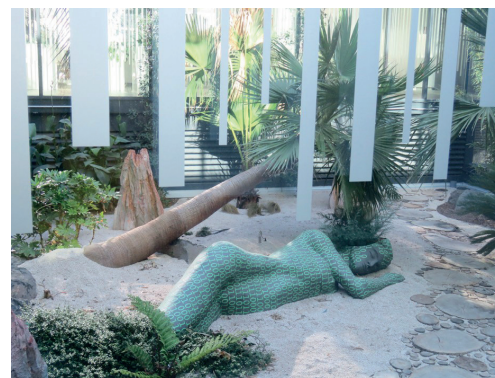
Exemple d'atrium Bureaux Septeo Lattes (FR-34)

L'atrium est un procédé connu depuis l'antiquité ; un élément central encore très souvent d'actualité grâce à de belles créations architecturales, intégrant une lumière naturelle optimale. Ce lieu de vie et de passage est néanmoins soumis, encore plus aujourd'hui qu'hier, aux fluctuations thermiques et aux fortes chaleurs en période estivale.